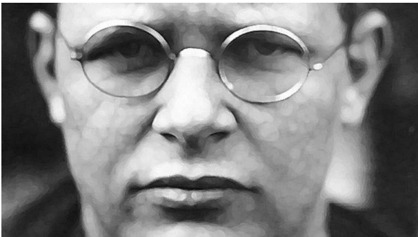
■ Dietrich Bonhoeffer (1906–1945)

umgeben. Aus diesem festen Vertrauen heraus, dass diese guten Mächte ihn „ treu und still umgeben “, wendet er sich an seine Familie, an die Menschen, die er liebt und die ihn lieben. Auf diese Weise geborgen, spricht er seinen traurigen Verwandten zu: „ so will ich diese Tage mit euch leben und mit euch gehen in ein neues Jahr. “ Er drückt damit aus: Die guten Mächte sind bei mir und bei Euch und auf diese Weise sind wir miteinander verbunden. Die Gefängnismauern trennen uns nur äusserlich, nicht aber in unserer Verbundenheit miteinander.