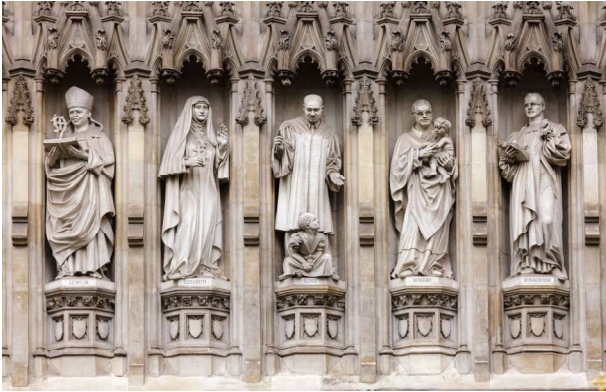
■ Détail de la façade de l'Abbaye de Westminster avec les martyrs chrétiens du XXe siècle Janani Luwum, la grande-duchesse Elizabeth de Russie, Martin Luther King Jr., Oscar Romero et Dietrich Bonhoeffer.

De cette solide confiance que les puissances bienveillantes l' « entourent fidèlement et silencieusement », il s'adresse à sa famille, aux personnes qu'il aime et qui l'aiment. Ainsi rassuré, il console ses proches attristés : « ainsi je veux vivre ces jours avec vous et entrer avec vous dans une nouvelle année ». Il s'exprime ainsi : Les bonnes puissances sont auprès de moi et de vous et de cette manière nous sommes liées ensemble. Les murs de la prison ne nous séparent qu'extérieurement mais non pas dans notre lien.