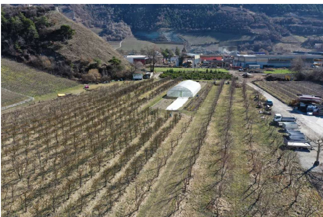
■ Landgut Zufferey in Granges

Chemie hat bei mir keinen Platz. Bei Gemüse und Obst praktizieren wir die Philosophie der 0 Pestizide, auch Bio. Wir düngen mithilfe von Wurmkompost oder Jauche, die immer pflanzlichen Ursprungs sind und aus der Nähe unseres Betriebs stammen. Die Fruchtfolge ermöglicht es, unsere Böden langfristig am Leben zu erhalten und zu verbessern, da wir unser Gewächshaus das ganze Jahr über auf die Parzellen verlagern können. Alles wird im Freiland angebaut, je nach Bedarf manchmal geschützt durch das Gewächshaus.